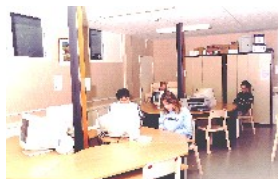
Des salles informatiques et un centre de ressources en réseau